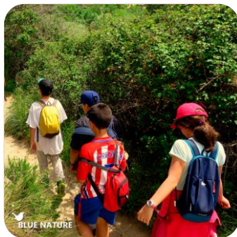
Ruta en familia por la sierra