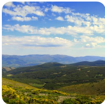
La Morcuera entrada al Parque Nacional