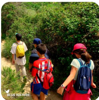
Ruta en familia por la Sierra