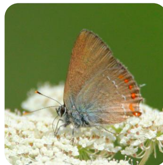
Senda de iniciación a la fotografía