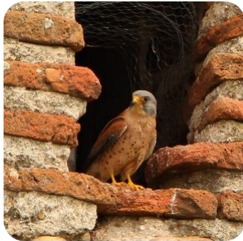
Aves esteparias en Madrid