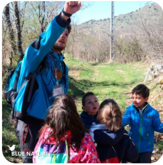
Nuestros vecinos con plumas