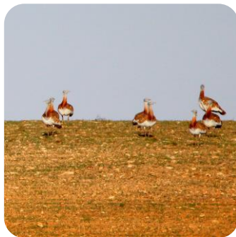
Aves esteparias en Madrid