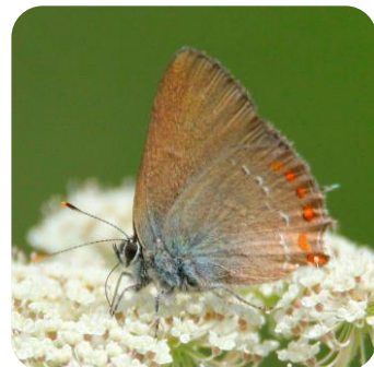
Senda de iniciación a la fotografía