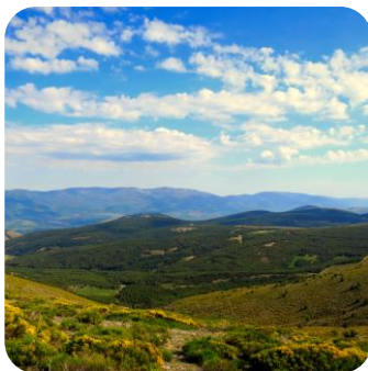
El puerto de la Morcuera, entrada al Parque Nacional