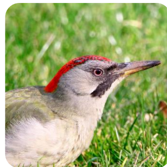
Las aves del Retiro